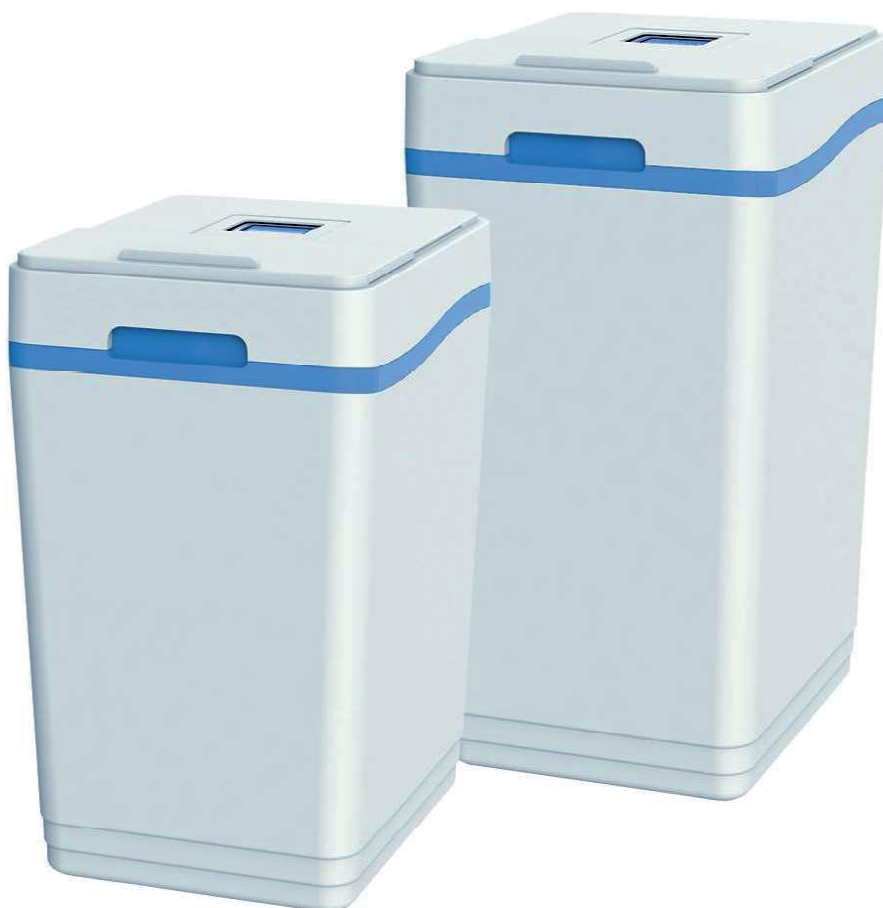
Zmiękczacze wody Aquaphor A800 i A1000

Stacje uzdatniania wody Aquaphor A800 i A1000 charakteryzują się w pełni zautomatyzowanym procesem pracy, bardzo wysokim stopniem redukcji żelaza i niskim zużyciem soli. W urządzeniach tych zastosowano innowacyjne głowice sterujące optymalizujące proces regeneracji złoża. Zbiornik dwusekcyjny łączy zalety filtra samoczyszczącego i zmiękczającego. Gwarantuje równomierny przepływ wody poprzez zamknięte złożo między dwoma dyskami filtrującymi. Wysokiej gęstości sito utrzymuje złożo żywicy, równocześnie zapewniając odpowiedni przepływ wody.